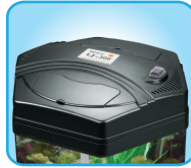
Color Negro ■