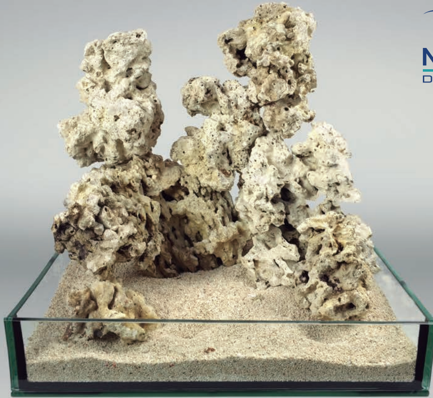
Sustrato: Decoline Aragonita natural # 2