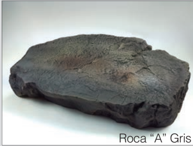
Roca "A" Gris