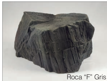
Roca "F" Gris