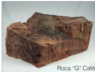
Roca "G" Café