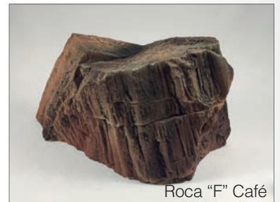
Roca "F" Café