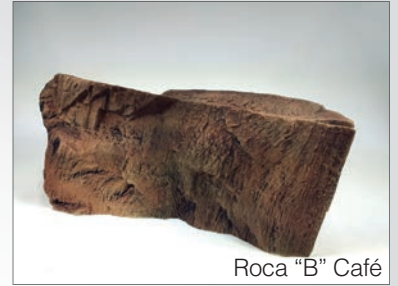
Roca "B" Café