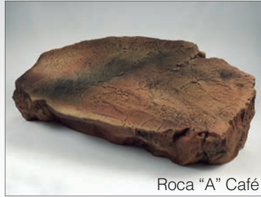
Roca "A" Café