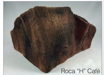
Roca "H" Café

Las rocas Rompecabezas servirán para darle un último toque de realismo a su fondo rocoso Decoline. Están realizadas de forma artesanal con la misma calidad, colores, textura y acabados de sus fondos rocosos a juego. Las espectaculares formas y volúmenes que presentan están tomadas a partir de moldes de rocas naturales, con la intención de aumentar el realismo 3D de los fondos rocosos de la marca. Están huecas por dentro y cuentan con una resistente pared de espuma de poliuretano de alta densidad texturizada con resinas y pigmentos atóxicos. Este espacio dentro de las piezas sirve además para ocultar elementos técnicos del acuario y ofrecer refugio a ciertas especies. También es un buen lugar de reposo o refugio para anfibios y reptiles en paludarios y terrarios. Puede fijar sus bordes a cualquier pared del acuario usando silicona, realizando así las dimensiones de su tanque y dando una sensación de "continuidad" en los extremos de su escenario.