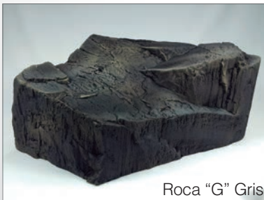
Roca "G" Gris