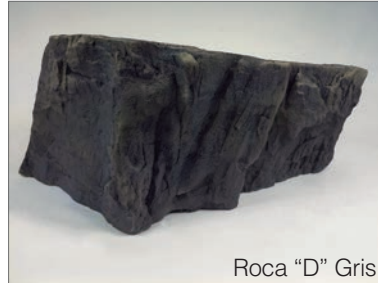
Roca "D" Gris