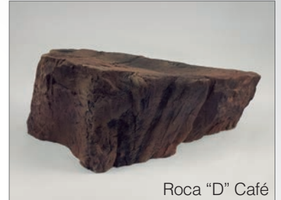
Roca "D" Café