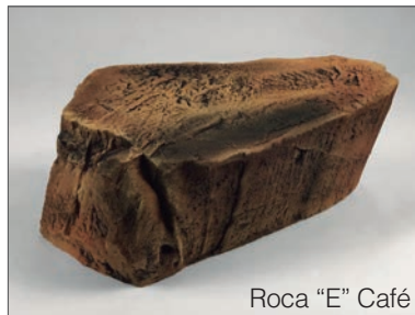
Roca "E" Café