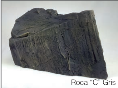
Roca "C" Gris