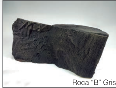
Roca "B" Gris