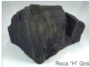
Roca "H" Gris