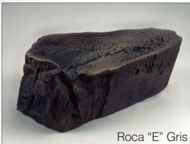
Roca "E" Gris