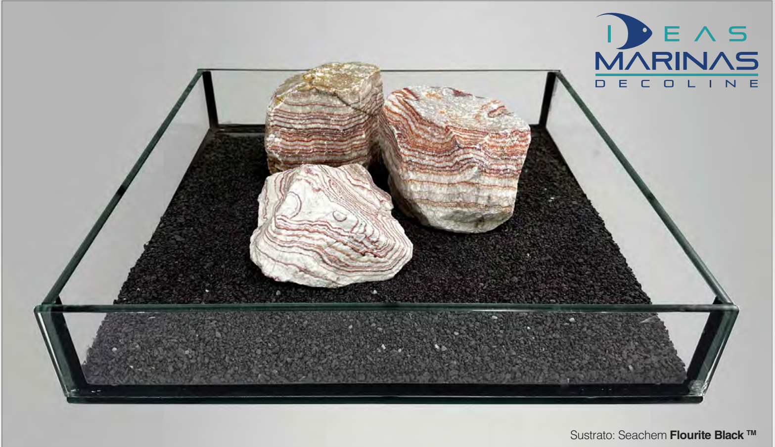
Sustrato: Seachem Flourite Black™