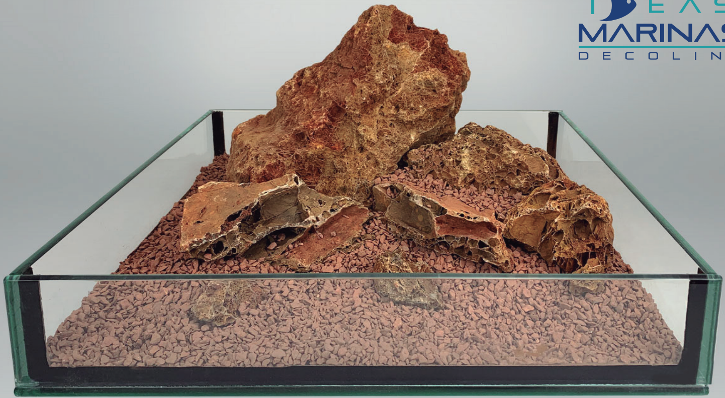
Sustrato: Seachem Flourite Red ™