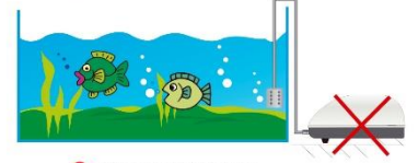
➡ Uso incorrecto