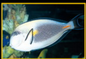
紅海騎士倒吊 學名: Acanthurus xanthurus 英名: Schol 分布: 紅海及印度洋 體長: 40 cm