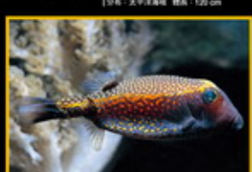
花木瓜 學名: Ostracion methyas 英名: Emperor Angelfish 分布: 太平洋東部海域 體長: 14 cm