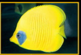
紅海黃金蝶 學名: Chaetodon semilineatus 英名: Red-sea Golden Butterfly 分布: 紅海及印度洋 體長: 19 cm