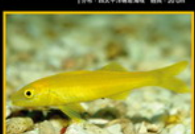
黃秋姑 學名: Pseudocheilodactylus 英名: Yellow Saddle Goatfish 分布: 太平洋東部海域 體長: 50 cm