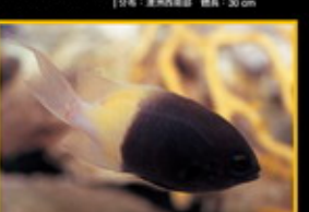
黑頂雀鯛 學名: Chromis viridis 英名: Banker Reef Chromis 分布: 太平洋東部海域 體長: 9 cm