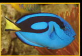
藍倒吊 學名: Paracanthurus hepatus 英名: Regal Blue Surgefish 分布: 印度-太平洋海域 體長: 26 cm