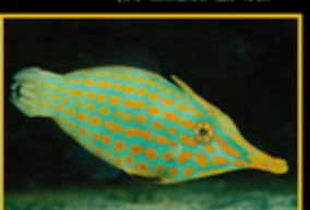
玉米砲彈 學名: Dymacanthus longirostris 英名: Black-striped Surgefish 分布: 印度洋太平洋海域 體長: 12 cm