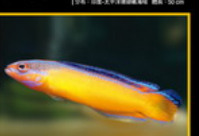
非洲草莓 學名: Pseudocheilodactylus 英名: Orange-striped Pteropoma 分布: 西印度洋東部海域 體長: 9 cm