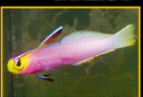
紫玉雷達 學名: Almondocheilus halibut 英名: Pink Surgefish 分布: 西太平洋 體長: 6 cm