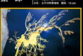
葉海龍 學名: Pseudocheilodactylus 英名: Orange-striped Pteropoma 分布: 澳洲東部海域 體長: 45 cm