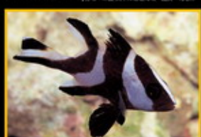
磕頭燕子 學名: Lipodactylus xanthurus 英名: Emperor Blenny 分布: 太平洋東部海域 體長: 90 cm