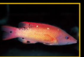
三點西班牙龍 學名: Bodianus lineatus 英名: Diana's Hogfish 分布: 印度洋太平洋海域 體長: 25 cm