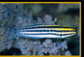
黑帶稀棘魚 學名: Microgobius gulosus 英名: Yellowtail Poison-fang Blenny 分布: 西太平洋海域 體長: 4 cm