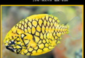
鳳梨魚 學名: Muraenichthys leucomelas 英名: Pine Surgefish 分布: 印度洋-西太平洋 體長: 16 cm