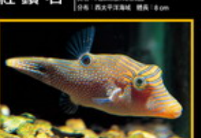
眼斑日本婆 學名: Carngaster aculeatus 英名: Honeycomb Toby Pufferfish 分布: 印度洋太平洋東部海域 體長: 11 cm