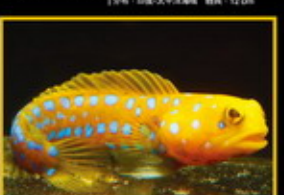
藍點鰐虎 學名: Quasipagrus roosei 英名: Non-Albino's Bluntnose Jawfish 分布: 西太平洋海域 體長: 10 cm