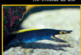
五彩鰻 學名: Muraenichthys leucomelas 英名: Ribbon Moray 分布: 太平洋東部海域 體長: 120 cm