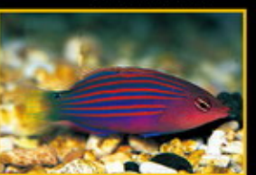
六線龍 學名: Pseudocheilodactylus hexastomus 英名: Saddlefin Wrasse 分布: 印度洋太平洋海域 體長: 16 cm