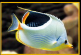
月光蝶 學名: Chaetodon argenteus 英名: Saddle-back Butterfly 分布: 印度洋太平洋海域 體長: 21 cm