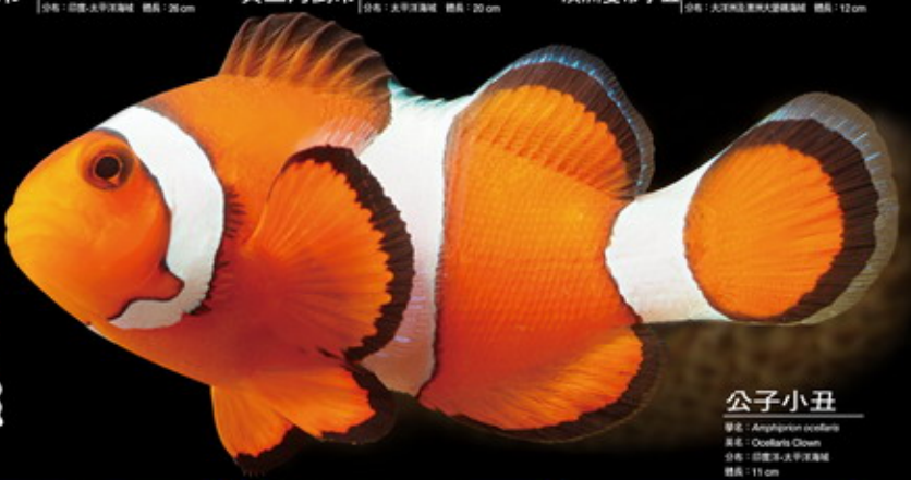
公子小丑 學名: Amphiprion ocellaris 英名: Clownfish 分布: 印度洋-太平洋海域 體長: 11 cm