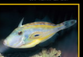
馬蹄砲彈 學名: Muraenichthys leucomelas 英名: Horse-shoe Leatherjacket 分布: 印度洋-太平洋海域 體長: 50 cm