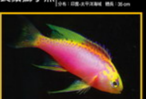
彩虹海金魚 學名: Pseudocheilodactylus 英名: Orange-striped Pteropoma 分布: 印度洋太平洋東部海域 體長: 11 cm