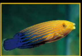
藍線橘龍 學名: Acanthurus lineatus 英名: Blue-striped Surgefish 分布: 印度洋太平洋海域 體長: 17 cm