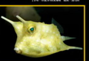
牛角 學名: Lactoria cornuta 英名: Longhorn Cowfish 分布: 印度洋-西太平洋海域 體長: 50 cm