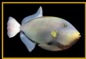
玻璃砲彈 學名: Melichthys indicus 英名: Pristigaster 分布: 印度洋太平洋海域 體長: 50 cm