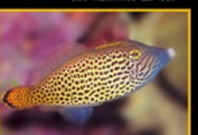
橙尾砲彈 學名: Pterapogon kauderni 英名: Orange-tail Fish 分布: 太平洋東部海域 體長: 12 cm