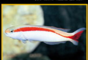
紅鵲鰐 學名: Hypodactylus marcosi 英名: Red Wrasse 分布: 西太平洋東部海域 體長: 50 cm