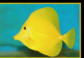
黃三角倒吊 學名: Zebrasoma flavescens 英名: Yellow Sailfin Tang 分布: 太平洋海域 體長: 20 cm