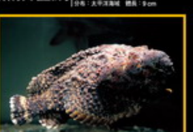
石頭公 學名: Syncaecops verrucosus 英名: Red Stonefish 分布: 印度洋太平洋東部海域 體長: 40 cm