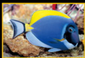
粉藍倒吊 學名: Acanthurus leucostomus 英名: Powder Blue Tang 分布: 印度洋東部及西印度洋 體長: 23 cm