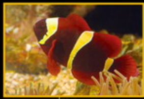
金透紅小丑 學名: Frenetia bicoloratus 英名: Spine-crested Anemonefish 分布: 印度洋太平洋海域 體長: 15 cm