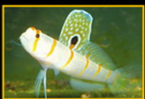
大帆鰐虎 學名: Pseudocheilodactylus 英名: Orange-striped Pteropoma 分布: 西太平洋、印度洋 體長: 9 cm