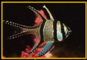
泗水玫瑰 學名: Pterapogon kauderni 英名: Banggai Cardinalfish 分布: 印尼海峽及巽他海峽 體長: 8 cm