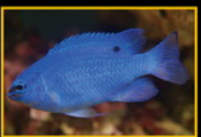
藍魔鬼 學名: Chrysipterus cyaneus 英名: Sapphire Devil 分布: 印度洋太平洋 體長: 8 cm