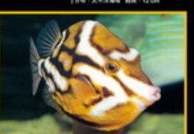
白線箱魷 學名: Anaplocheilichthys leucomelas 英名: Whitethroated Surgefish 分布: 澳洲東部海域 體長: 30 cm